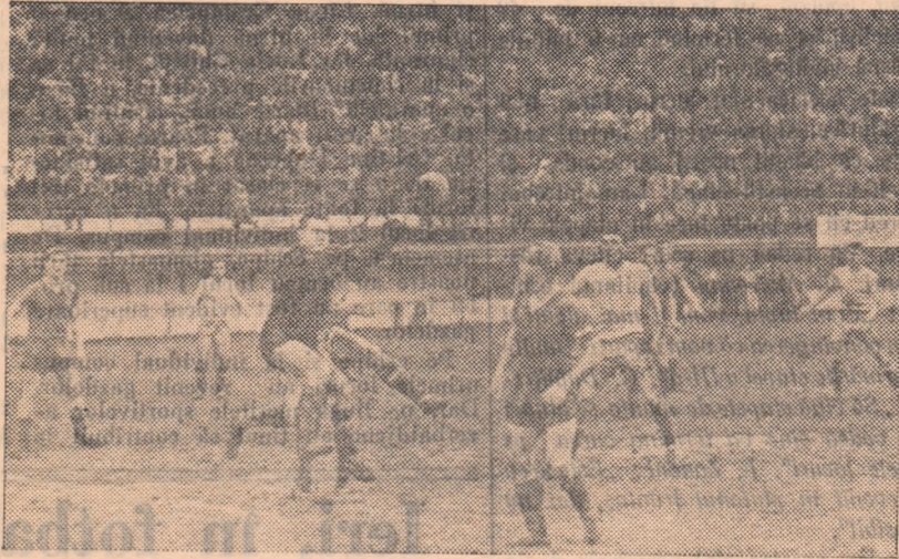
Fază din jocul Lotul de tineret al R. P. Române — Wismut Aue. Portarul oaspeților respinge cu pumnii balonul ce se îndrepta spre poarta echipei sale.