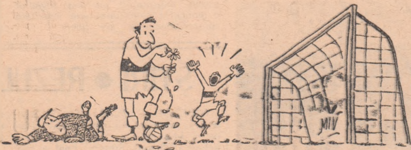
— Să trag... să pasez... să trag... să pasez...