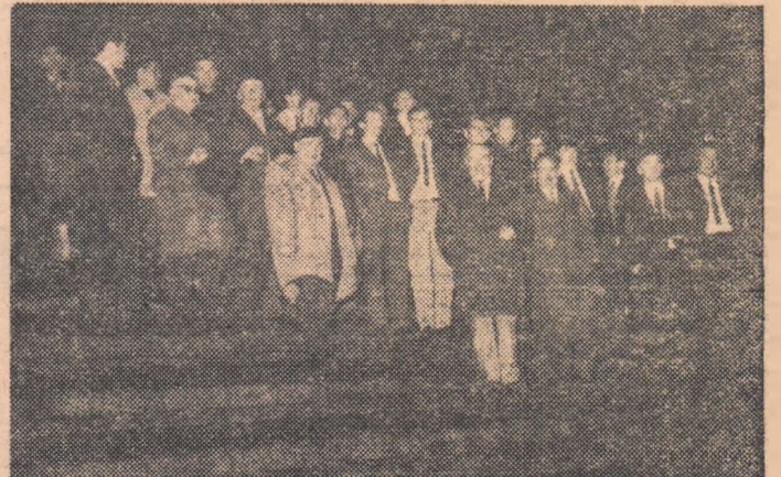
Rugbiștii francezi în vizită pe stadionul „23 August” la puțin timp după sosirea în Capitală.