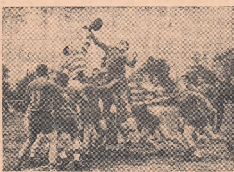
Finala campionatului universitar de rugbi al Franței a reunit la Bordeaux, echipele Bordeaux E.C. și Paris Université Club. A câștigat echipa din Bordeaux la un scor concludent: 21-6. În fotografie: rugbiștii de la B.E.C. și P.U.C. își dispută o „tușă” spectaculoasă.