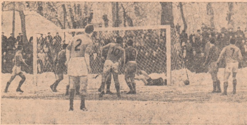
Fază din meciul Dinamo Pitești — Steaua (0—1), disputat anul trecut, la Pitești