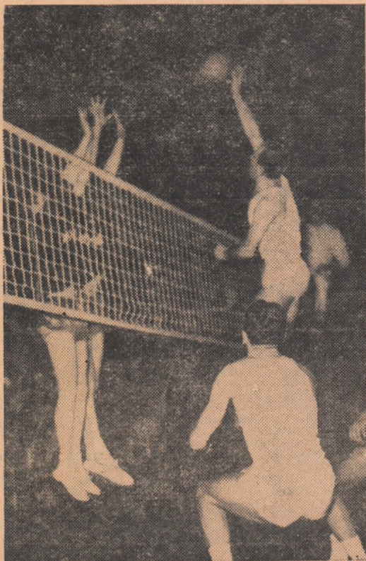
Dublul de Ferariu, Plocon (Rapid) trage ușor peste blocajul echipei Minior Pernik

Ieri seară în sala Floreasca voleibaliștii de la Rapid au întâlnit din nou echipa Minior Pernik, în cadrul finalei „Cupei campionilor europeni”, învingând cu același scor cu care au pierdut în meciul disputat în Bulgaria la 9 Mai: 3-1. Cele patru seturi ale meciului, desfășurate în 2 de minute, s-au încheiat cu rezultatele de 5-7, 8-15, 15-8 și 5-9, evoluția scorului în cadrul lor fiind următoarea: 1-0, 1-2, 4-2, 1-4, 11-4, 11-6, 14-6, 4-7, 15-7; 0-5, 4-5, 1-6, 5-6, 5-10, 7-10, 7-12, 8-12, 8-15; 2-0, 2-1, 7-1, 7-3, 8-3, 3-5, 9-5, 9-6, 11-6, 11-8, 15-8; 0-2, 1-2, 1-4, 2-4, 2-5, 7-5, 7-6, 11-6, 11-7, 12-7, 2-9, 15-9.