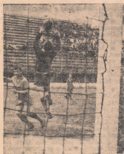
Fază din meciul Tehnometal București — Rapid Mizil (1-1)

eliminarea lui Dancu (Portul) și Bejan (Marina) pentru lovire reciprocă. Golul oaspeților a fost înscris de Stănciță (min. 54). Conducerea asociației sportive Marina continuă să manifeste nepăsare în organizarea meciurilor: spectatorii au intrat în teren, au lip-sit oameni de ordine, ceea ce a dus la bruscarea jucătorilor de la Portul, la ieșirea acestora de pe teren. (E. Petre, — coresp.). UNIREA RĂCARI — RULMENTUL BRAȘOV (0-2). Meci frumos până în