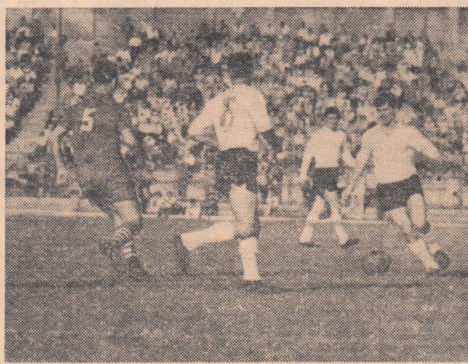
Fază din meciul Dinamo București — Steagul roșu Brașov disputat în sezonul trecut la București