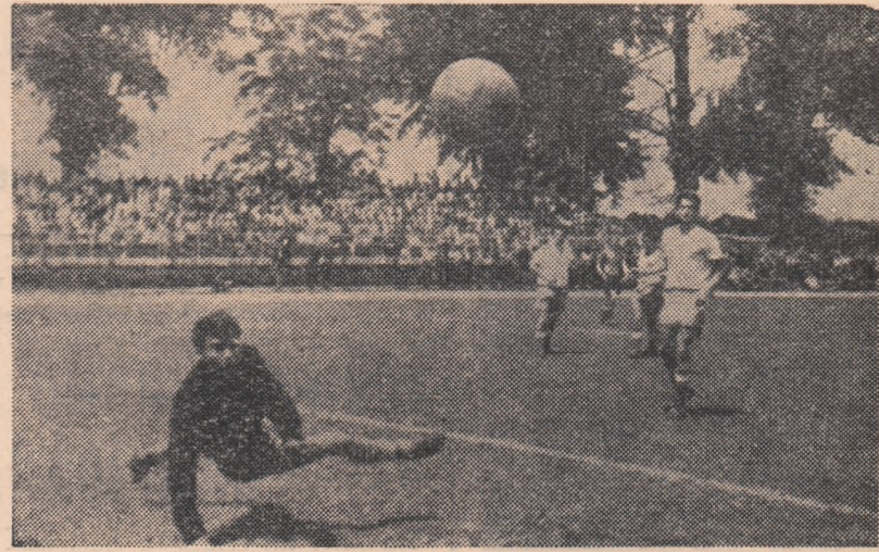
Atac la poarta echipei Metalul—Tirgoviște