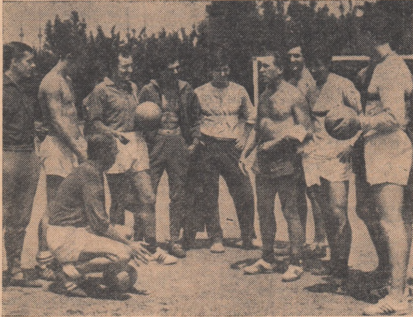
Fotbaliștii de la Stade Français la antrenamentul efectuat ieri pe stadionul „23 August“.