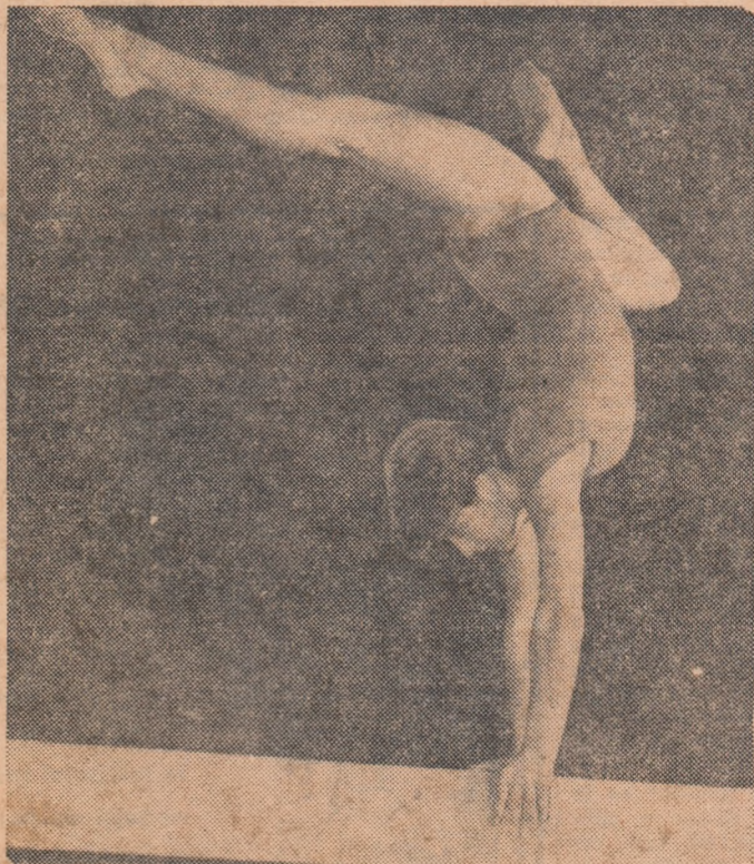
Un trumos exercițiu la birnă pe care sperăm să-l vedem la fel de bine executat cu pilejul campionatelor republicane școlare de gimnastică

În mai buni dintre zecile de mii de școlari care au luat startul în întreceri se pregătesc în aceste zile pentru sfîrșitul de an sportiv. Ediția 1964—65 a „republicanelor“ școlare programează finalele la cinci ramuri de sport,