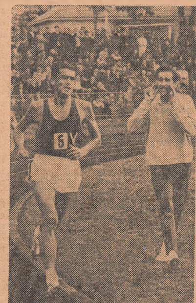
Aspect din cursa de 10 000 m în care Ron Clarke a stabilit noul record mondial al probei: 28:14,0. Pe margine, atletul englez Gordon Pirie îl încurajează pe sportivul australian.

Revista de specialitate „DER LEICHTATHLET“ din Berlin (R.D. Germană) publică un articol despre felul în care se pregătește atletul Ron Clarke. Într-o formă sportivă excepțională, la ora actuală, fondistul australian a realizat acum cîteva zile un nou record mondial în proba de 10 000 m: 28:14,0. Publicăm mai jos fragmente din articolul referitor la antrenamentele lui Ron Clarke.