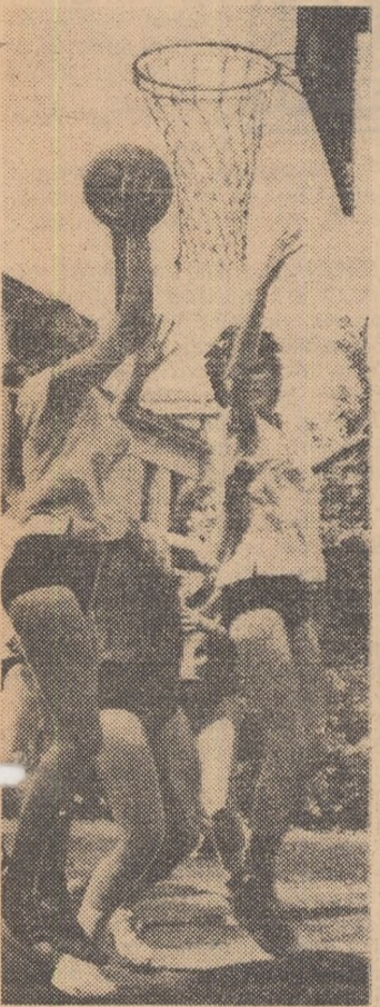
Dinamism și dirzenie! Iată ce caracterizează această aprigă luptă pentru balon, surprinsă în jocul feminin de baschet Timișoara—Cluj, din cadrul finalelor Campionatelor universitare.