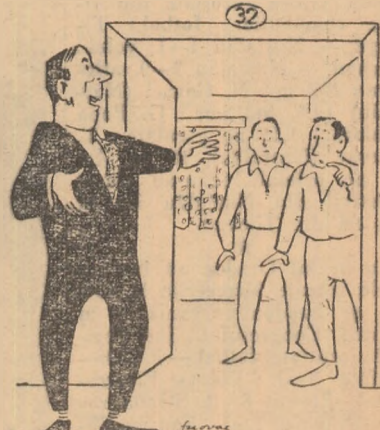
— Ospitalitatea noastră ieșeană este proverbială: cînd ai venit v-am întîmpinat cu „Bun sosit“ iar acum... plecați pentru ca să vă putem spune „Drum bun“!!!

După corespondențele trimise de: St. Gurgui, B. Stoiciu, I. Onicel și E. Ursu