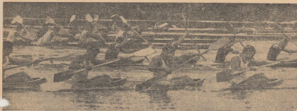
O spectaculoasă plecare în proba de caiac 4.