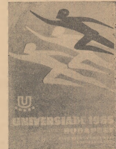
de lațura cultural-distractivă. Delegația română va fi patronată de fabrica de vagoane Ganz MAVAG — care va avea grijă ca tinerii sportivi din România să se simtă bine la această mare întîlnire a tineretului.

Fiecare delegație va fi patronată de un colectiv de tineret al unei marți fabrici sau uzine, colectiv ce va avea grijă