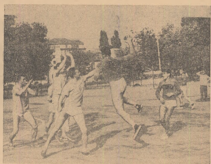
În seria a II-a a turneului masculin de handbal au avut loc ieri jocuri interesante. În fotografia noastră, o fază din întîlnirea Oradea — Suceava, cîştigată de orădeni.

Organ al Uniunii de Cultură Fizică şi Sport din R. P. Română