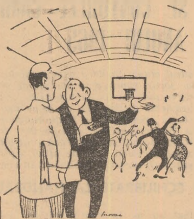
— Cum poți spune că ceea ce facem noi aici n-are legătură cu sportul? Priviți: sulețe, rezistență, fente...

În vederea pregătirilor pentru viitoare întreceri, lotul republican de parașutism s-a deplasat la Iași. Sportivii au fost găzduiți la hotelul „Iașul“, dar după două zile au fost evacuați pentru a se da camerele unei echipe de teatru.