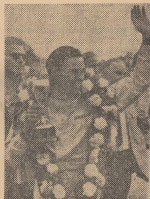
realizînd un nou record al probei. El este cel de al 4-lea european care a triumfat la această întrecere, câștigată de obicei de americani. Pe automobilul său „Lotus”, cu un motor „Ford”, el a realizat pe distanța de 500 mile (804 km.) o medie orară de 242,453 km. Iată-l în fotografie, după cursă.