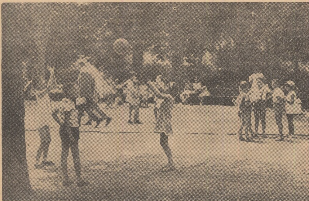
Lipsiți de orice grijă, copiii noștri își petrec vacanța învăluiți de dragoste și atenție pentru odihna lor. Jocurile lor copilărești pregătesc pe viitorii sportivi ai țării.