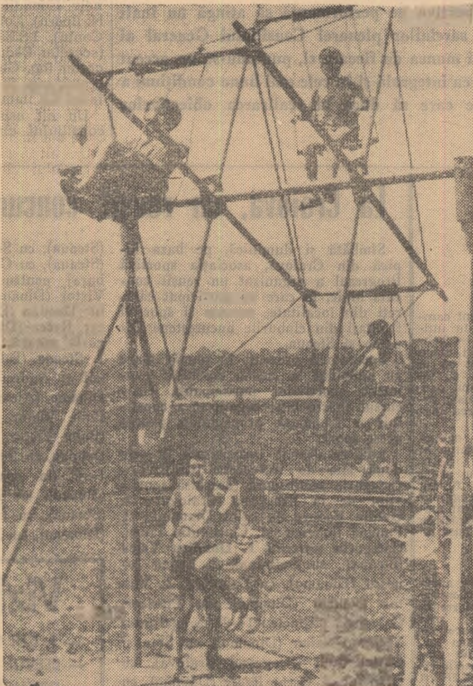
Vacanță! La Cimpina, ca și în întreaga țară, copiii se bucură în acele zile de vară de condiții tot mai bune pentru petrecerea vacanței în joc și voie bună

publicului bucureștean că și-au cîștigat calificarea practicînd un fotbal modern, de calitate. În meci vedetă, Dinamo București — campioana țării întîlnește pe Știința Cluj — cîștigătoarea „Cupei R.P. Române”.