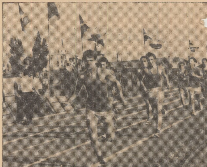
Aspect de la întrecerile desfășurate pe terenurile de sport ale Casei Științei