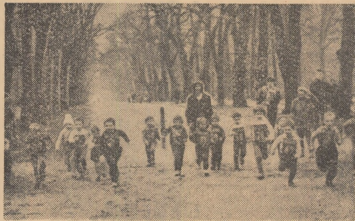
„Sportivi“. Iar ei dovedesc cu adevărat alură de sportivi și cine știe dacă printre aceștia nu se găsește viitori campioni!...

CROSUL CELOR SUB 6 ANI! Primul cros din R.P. Ungară fără... participanți pe care ne-am obișnuit să-i vedem. Locul lor a fost luat de micuții