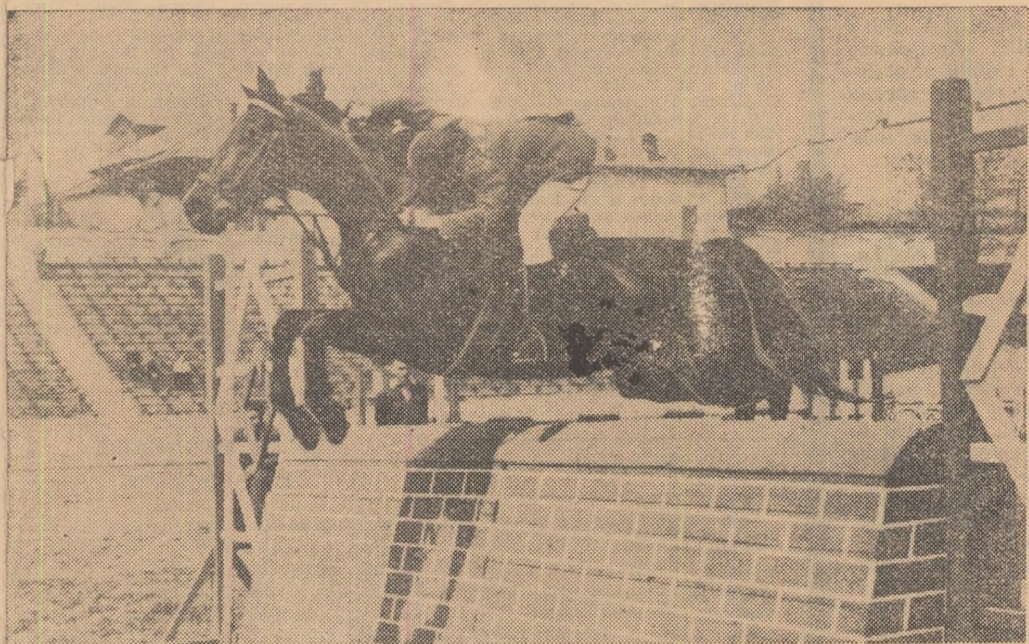
Deosebit de spectaculoase, întrecerile de obstacole la cîlărie vor fi prezente în programul manifestațiilor sportive organizate, la sfîrșitul acestei săptămîni, în întîmpinarea celui de al IV-lea Congres al partidului

Pregătirile pentru manifestațiile sportive care vor avea loc sâmbătă și duminică în Capitală sînt în toi. Dornici să realizeze performanțe cît mai bune în cadrul întrecerilor închinete celui de al IV-lea Congres al partidului, sportivii din cluburi și asociații se pregătesc intens sub îndrumarea antrenorilor, lată acum programul complet al competițiilor care vor sta la dispoziția pasionaților sportului din Capitală.