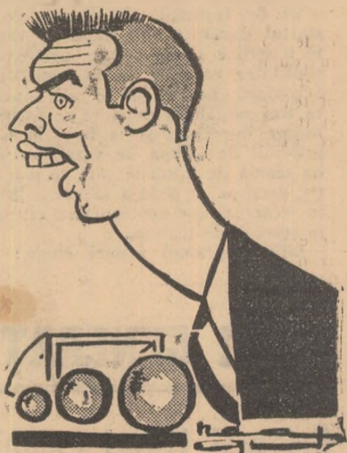
PHILL WOOSMANN văzut de NEAGU RĂDULESCU