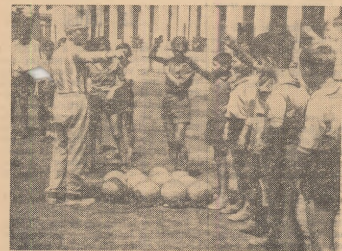
Cine vrea să execute primul? Aspect de la centrul de antrenament pentru copii, care funcționează la terenul Progresul

echipe și sute de „pitici” s-au întrecut săptămîna de săptămîna.