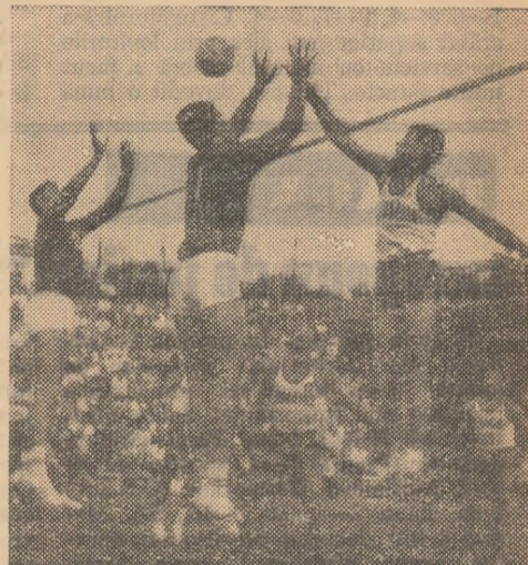
Fază din întîlnirea România — Franța disputată la București