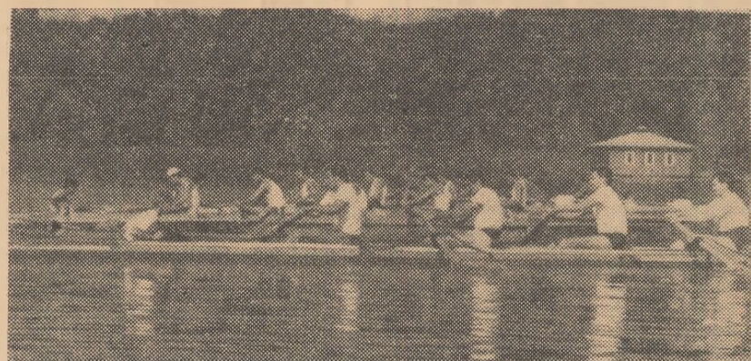
Schifuri de 4+1 în intrecere