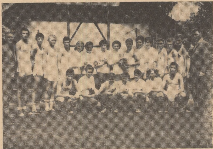
O amintire plăcută: o fotografie făcută de componenții echipelor S. M. nr. 2 Tg. Mureș (băieți) și S.S.E. Brașov (fete) imediat după îmbrăcarea tricourilor de campioni republicani la juniori.

element în orice fel de concurs? Ne-au dovedit-o, în primul rînd, echipele masculine din Tg. Mureș, Oradea și cea feminină din Brașov care, adăugînd pregătirii și o disciplină fermă, au reușit să obțină cele mai frumoase rezultate. A surprins, în schimb, în mare măsură clasarea cu mult sub posibilități a formațiilor masculine (S.S.E. nr. 1 și T. Dinamovist) și a celei feminine (Rapid) din