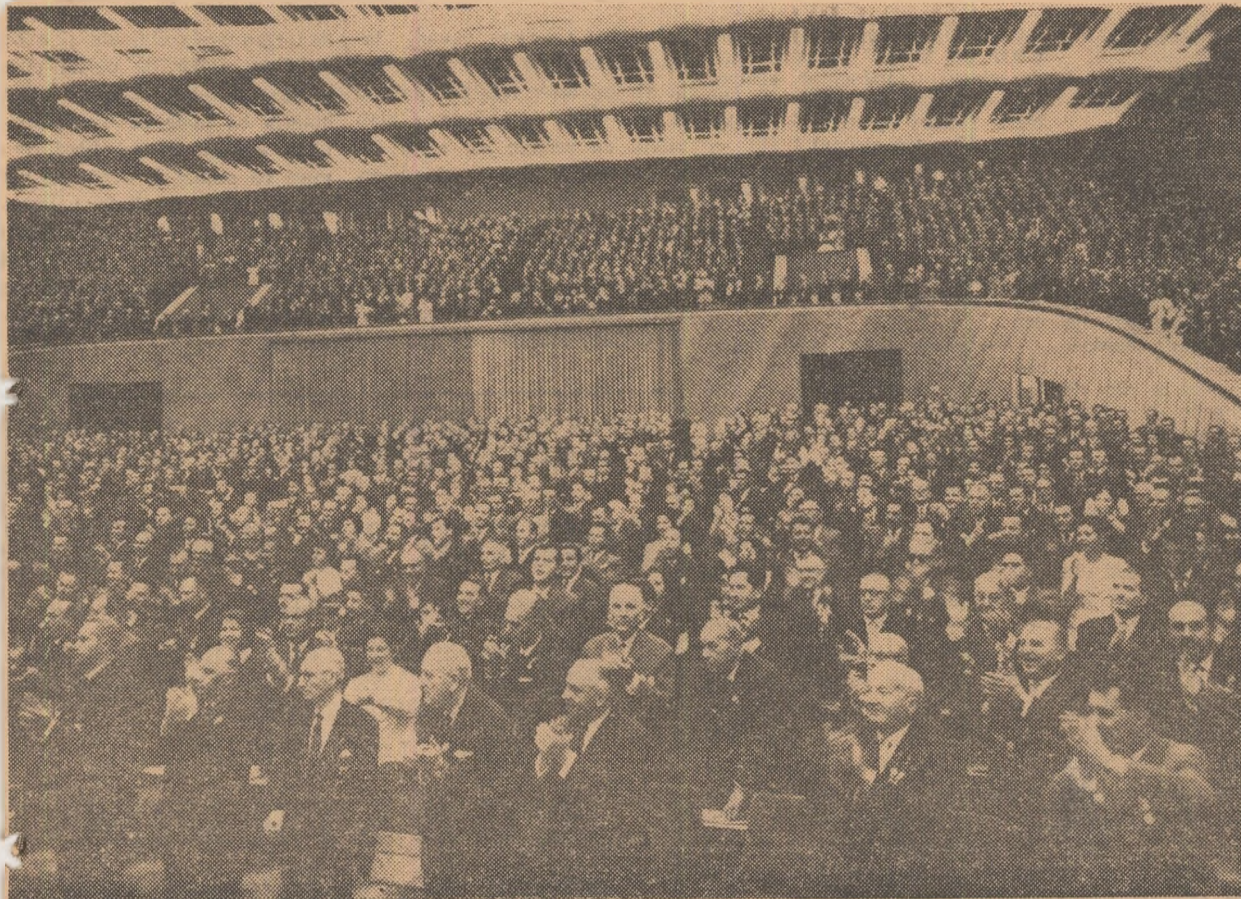
Aspect din sala Congresului