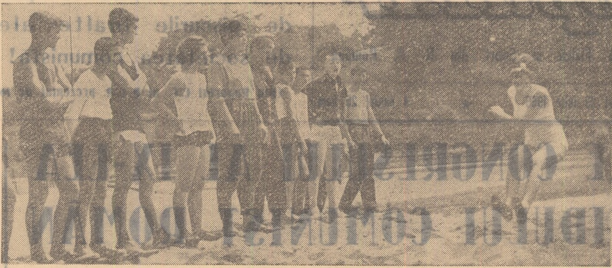
Aspect din activitatea centrului de inițiere în atletism, la Progresul

Dar, oricât ar părea de curios, la aceste cluburi există și secții (și nu din cele mai puțin importante) în care munca și rezultatele în acest domeniu, al selecției, lasă de dorit. Iată, de