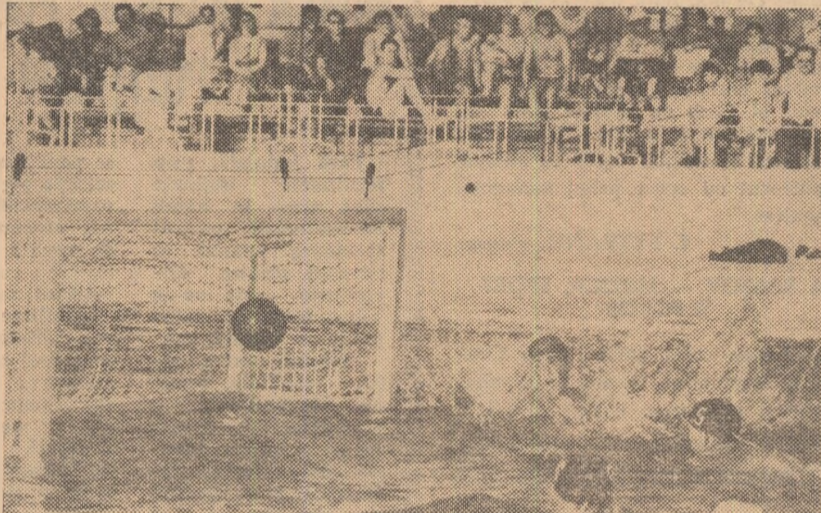
Portarul suedez Kindblom privește... neputincios la balonul care se îndreaptă spre plasă. Un nou gol pentru echipa noastră. Fază din meciul România-Suedia (9-2) disputat ieri la bazinul Dinamo