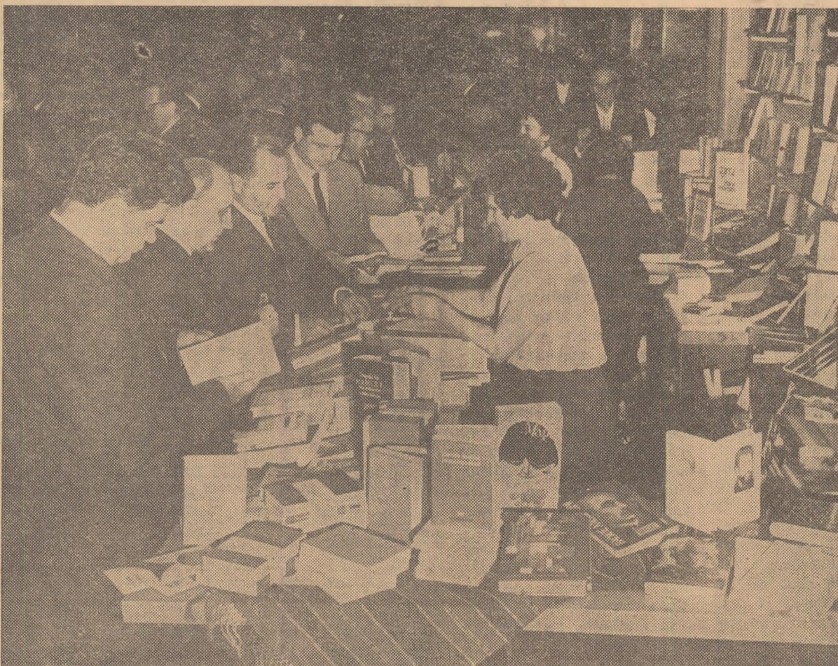
Intr-o pauză a lucrărilor — delegați la Congres în fața standurilor de cărți

Azi, în jurul orei 11, posturile noastre de radio și televiziune vor transmite, din Sala Palatului R. P. Române, lucrările Congresului al IX-lea al Partidului Comunist Român.