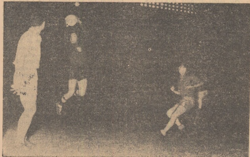
Cea mai recentă confruntare dintre cele două fruntașe ale fotbalului nostru, Dinamo București și Știința Cluj, a dat naștere la o partidă pasionantă, încheiată cu scorul de 2—2.

Evoluția dinamoviștilor în această ediție a lăsat, însă, să se întrevadă și unele lipsuri, recunoscute (ceea ce e bine) de însuși antrenorul principal al echipei, prof. Angelo Niculescu, cu care am discutat mai pe larg. Acesta s-a arătat nemulțumit de felul în