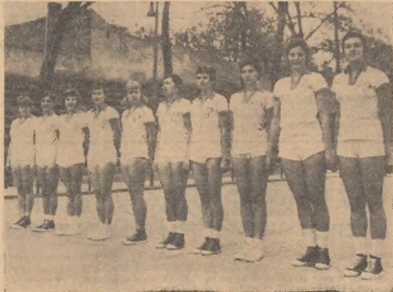
Echipa Radnicki Belgrad, campioana Iugoslaviei