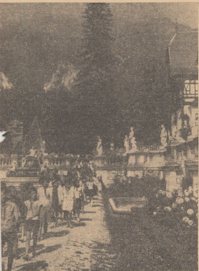
O parte din zilele de tabără sînt rezervate excursiilor. Grupul de elevi din fotografia noastră vizitează Castelul Peleş din Sinaia