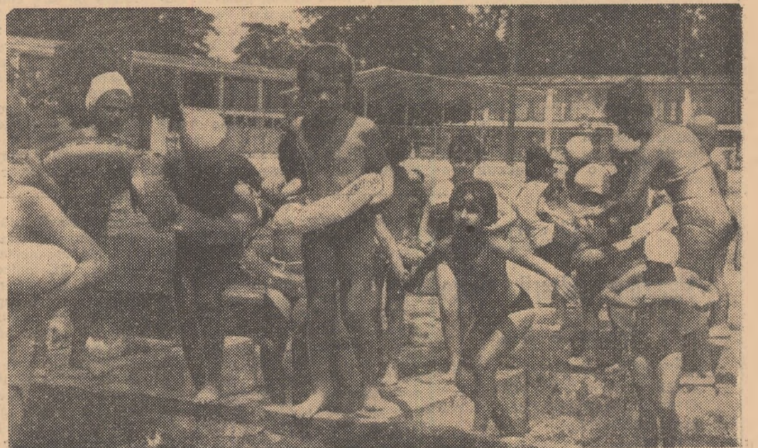
În primele lecții colacul este un element de care nu te poți dispensa. Parcă ai mai mult curaj să te avînți în apă...