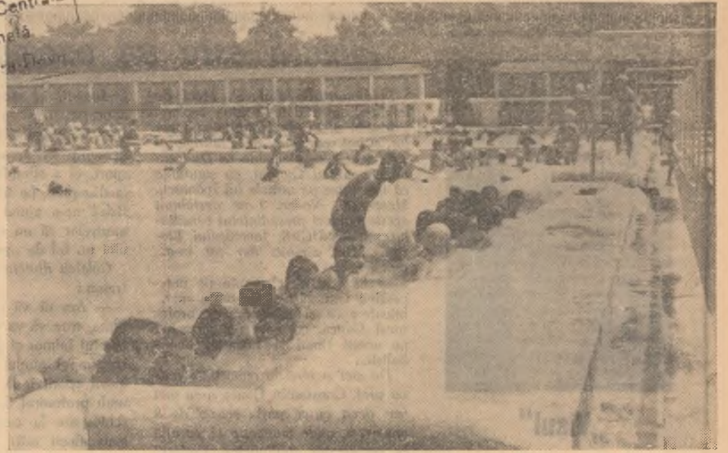
O nouă „promoție” de viitori înotători a luat zilele acestea primul contact cu apa la strandul Tineretului din Capitală.