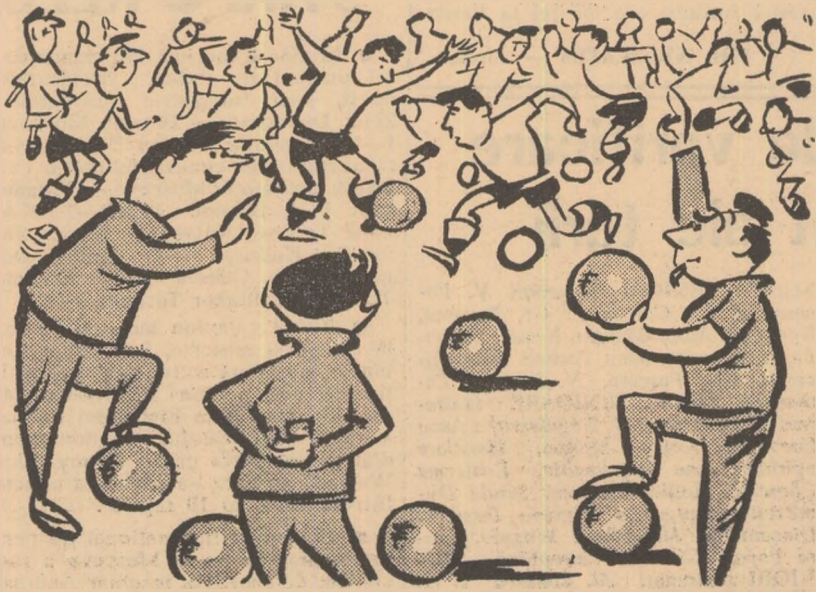
La Știința Timișoara, ziua bună se cunoaște de dimineață desen de Neagu Rădulescu

Petrolul Ploiești intenționează să aibă o comportare frumoasă în viitorul campionat. De aceea, pregătirile sînt în toi în această perioadă. După cum ne-a informat prof. C. Cernăianu,