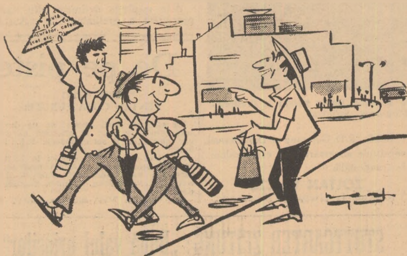
— Ați plecat în concediu? Sinaia, Predeal? — Nu, ne ducem la teren! Au început echipele să se antreneze.