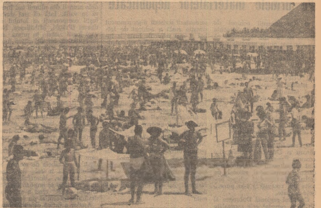
Litoralul... Din toate colțurile țării, zeci și zeci de mii de oameni ai muncii vin să-și petreacă aici măcar o parte din concediu (cealaltă parte... rezervată muntelui!), să înoate (dacă știu) sau să se scalde în apa răcoroasă a mării, să facă plajă, să se recreze. Și există și aici o întrecere pasionantă — un adevărat campionat! — pentru „titlul” de cel mai... bronzat om de pe litoral