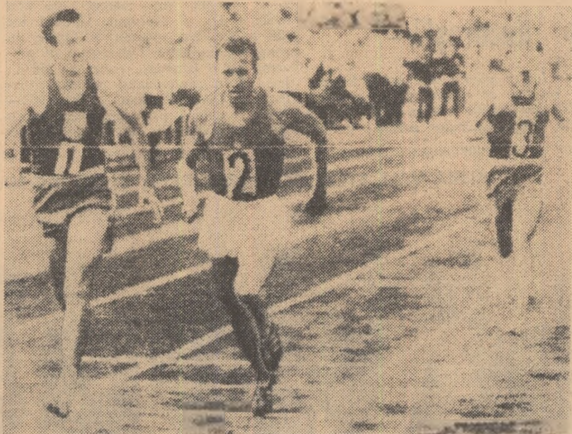
Finalul cursei de 5000 m: Piotr Bolotnikov (cu numărul 2) îl învinge pe campionul olimpic Robert Schul.