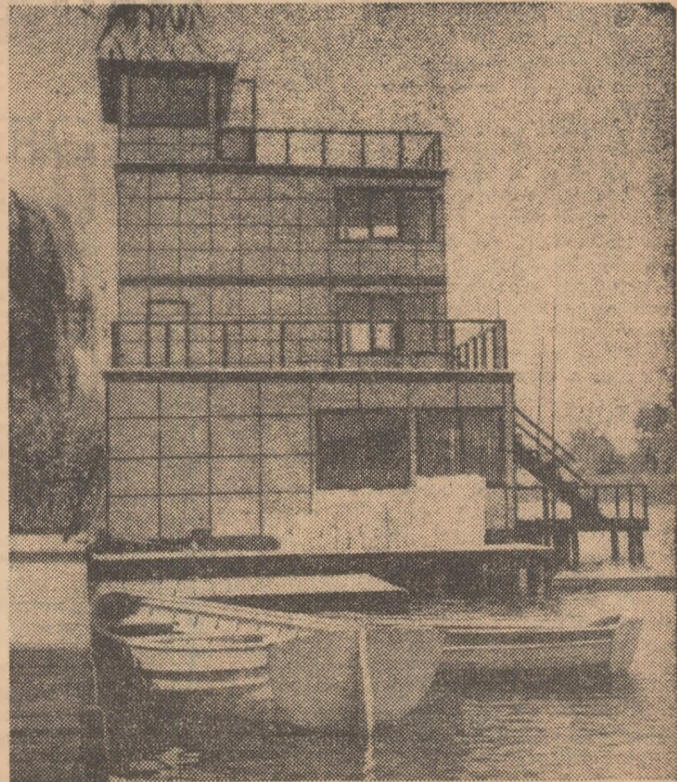
În fața acestui turn de arbitraj se vor face sosirile la campionatul european de caiac-canoe