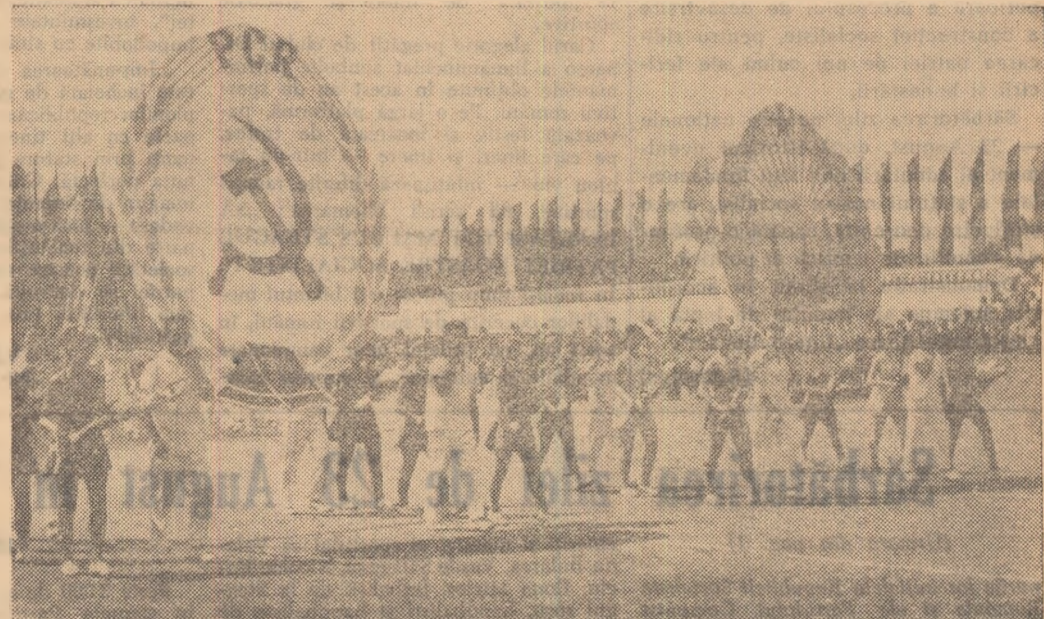
Sportivii poartă cu dragoste și mîndrie stema partidului și stema Republicii Socialiste România