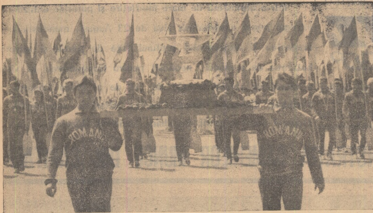
Un trofeu strălucitor: cupa decernată sportivilor români, pentru primul loc pe națiuni la campionatele europene de caiac-canoe