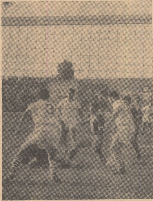
In prima repriză înaintarea echipei Farul a ratat o mare situație de gol. În fotografie momentul amintit mai sus

CONSTANȚA 24 (prin telefon de la trimisul oștru). — Calitatea partidei a lăsat mult de dorit luni pe stadionul „1 Mai” din localitate, plin însă la refuz. S-a jucat lezlnat, anost, greșelile au abundat, mai ales în prima repriză. Cei peste 5000 de spectatori au apreciat însă risipa de energie făcută de jucătorii la Rapid și Farul care au angajat într-o aprigă necleștare pentru cele două puncte, obținute până a urmă — meritat — de cureștenii. Meritat, pentru că ei au prezentat un ansamblu ceva mai încheșat și pentru că atacul lor a știut să fructifice două din puținele ocazii avute.