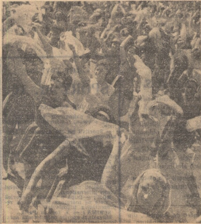
Tinerețe, entuziasm, bucurie

Ca un fluviu al tinereții triumfătoare se revarsă coloana clubului Olimpia. Băieți cu alură athletică, în mîndru pas de defilare, fete zvelte, surizătoare, fac un aplaudat exercițiu cu semicercuri înflorate, dau viață unei atrăgătoare palete de culori. Apoi, grupul sportivilor de la Progresul din care remarcăm mulți copii și juniori... Alb-