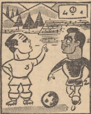
Popa către Năftănăilă: — Totuși, ne mai sînteți datori șase goluri...