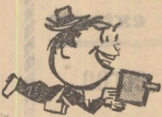
În etapa a III-a s-au marcat douăzeci de goluri.

Răspunzînd unei invitații, echipa Steaua va evolua miercuri la Viena, avînd ca adversară într-o partidă amicală reprezentativa armatei austriece, alcătuită din jucători care activează în prima categorie. Fotbaliștii militari părăsesc Capitala în cursul dimineții de azi.