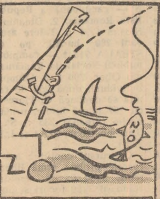
— În fine! Am scos și eu ceva!