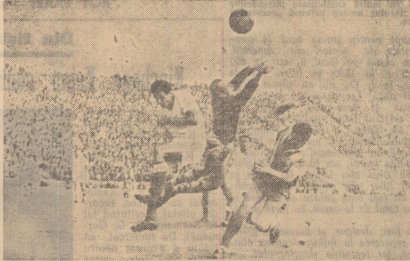
Un vîrf de atac, Babote, izolat între trei apărători ai echipei C.F.R. Pașcani. Fază din meciul Progresul—C.F.R. Pașcani (2—1)