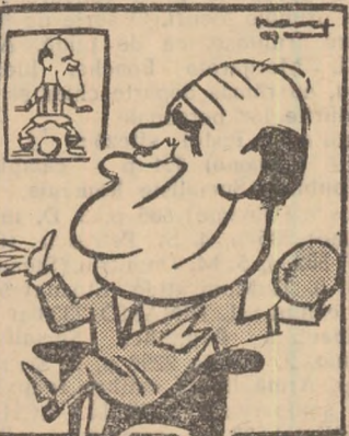
Ionică Bogdan: — Păi se putea altfel, cînd eu am fost vedeta?