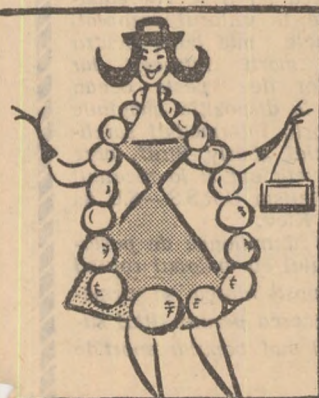
— Un colier ca acesta îmi place!