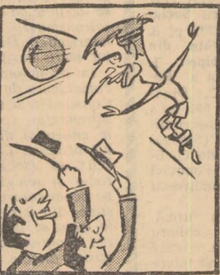
— Jos pălăria! Cînd îți lași driblingul la vestiar, îți descoperi capul!