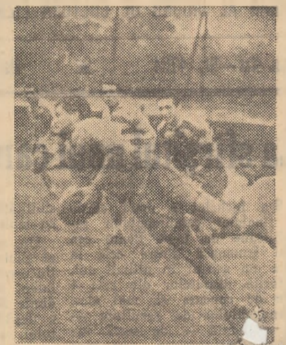
Fază din meciul Constructorul București—Știința Cluj (3—0)

cînd lipsește. Pe terenul Gloria, jucătorii ambelor echipe (Gloria și Ruimentul) au părut mai preocupați de... răzuieli personale, subiect asupra cărui vom reveni. În sfîrșit, Constructorul, favorită... „solist”, n-a putut să-și impună categoric punctul de vedere, deși Știința Cluj ne-a furnizat încă o dată explicația „lanternei roșii” și marchează dificultăți de înțelegere a unui „XV” cît de cît onorabil pentru categoria A.