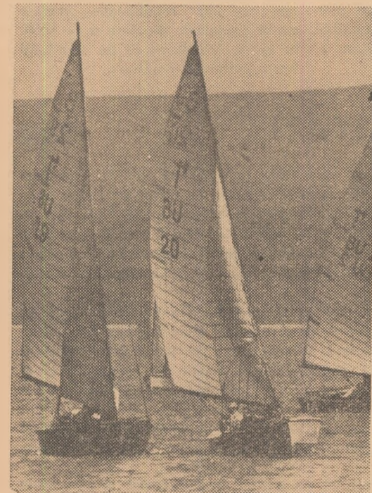
Întrecere de vele pe lacul de acumulare „Iscăr” din apropierea Solnei

CONSTATINDU-SE că unii pugiliști profesioniști se folosesc de „accidente tehnice” pentru a... trage de timp, federațiile din S.U.A. au hotărît ca, pe viitor, pînă ce-și pun la loc protezele de protecție boxerii să fie numărați. Dacă și le scot singuri, primesc avertisment!