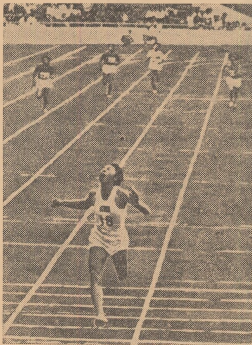
Sin Kim Dan, deținătoarea recordului lumii în probele de 400 și 800 m, într-un linisș victorios.

● Cele mai îndrăgite discipline sportive în R.P.D. Coreeană sînt: fotbalul, tenisul de masă, patinajul, halterele, judo și boxul. În aceste sporturi, reprezentanții R.P.D. Coreene au obținut frumoase succese și în întîlnirile internaționale.