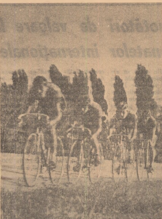
Echipa de juniori Steaua, campioană la urmărirea, în timpul evoluției.