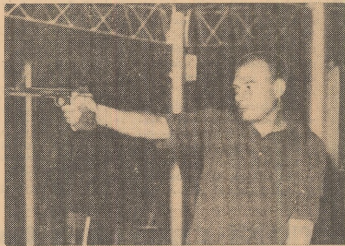
Primul antrenament pe noul stand de pistol viteză de la Tunari. Trăgătorul elvețian Albrecht — locul 5 la Tokio cu 590 de puncte — în timpul unei serii.