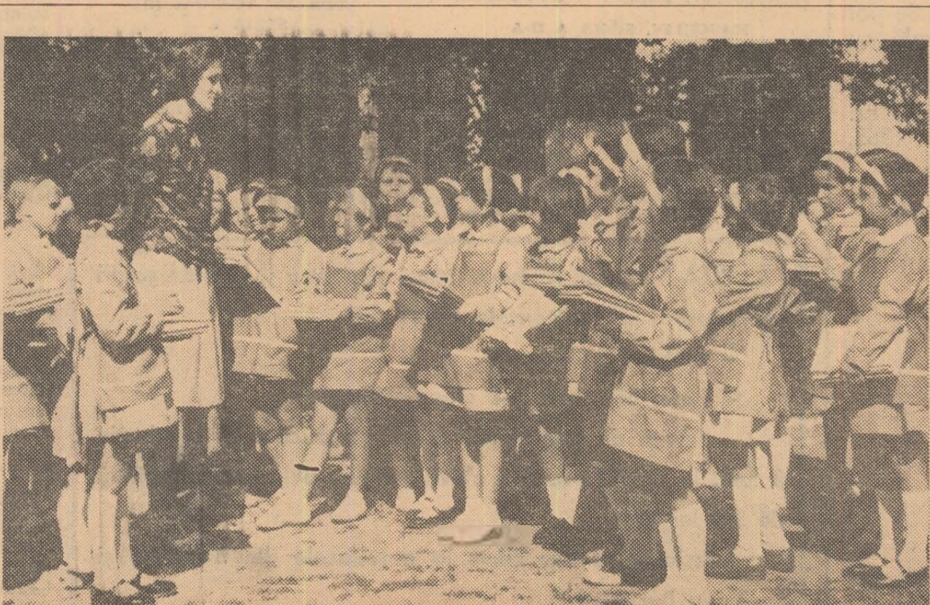
A început școala...

cea mai mare participare înregistrată vreodată la congresele C.I.P.S. Congresul va discuta organizarea pescuitului sportiv, turismul pe lîne de pescuit, protecția apelor, stabilirea locului de desfășurare a campionatului mondial de pescuit staționar pe anul 1966 etc.