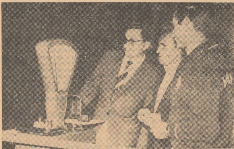
O formalitate absolut necesară: cântărirea pistoalelor de concurs. Pentru a evita orice surpriză trăgătorii bulgari fac din timp această operație.