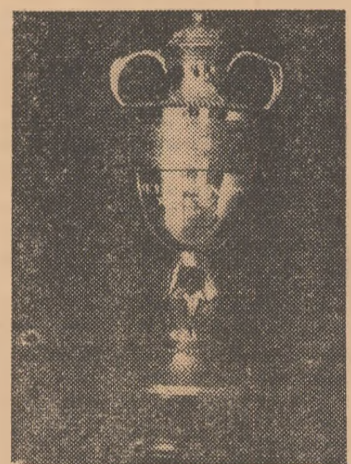
Inițiată de A.G.V.P.S. Cupa transmissibilă „Delta Dunării” va fi oferită echipei care va obține cele mai bune rezultate.

— S-au făcut amenajări speciale? — Da, s-au amenajat alei de acces pentru public la locul concursului, tribune, estrade etc. — Vă rog câteva cuvinte despre modul cum se vor desfășura întrecerile. — Echipele vor