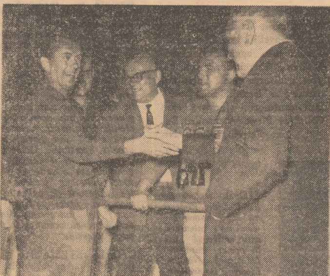
Felicitări pentru Jozef Zapadzki (Polonia), primul din stînga, campion european la proba de pistol calibrul mare

ția. Dacă Atanasiu și Dumitriu, de pildă, obțineau punctaje la posibilitățile lor echipa noastră ar fi putut urca cu două-trei locuri în clasamentul pe țări. REZULTATE: 1. J. Zapadzki (Polonia) 586 p (292 p la precizie + 294 p la viteză) — campion european, 2. V. Kudrna (Cehoslovacia) 586 p (291 +