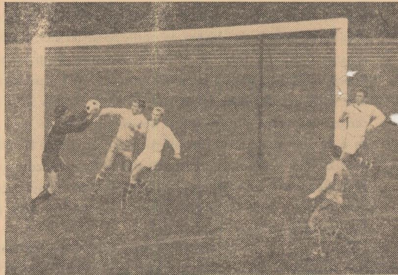
Fază la poarta gazdelor.