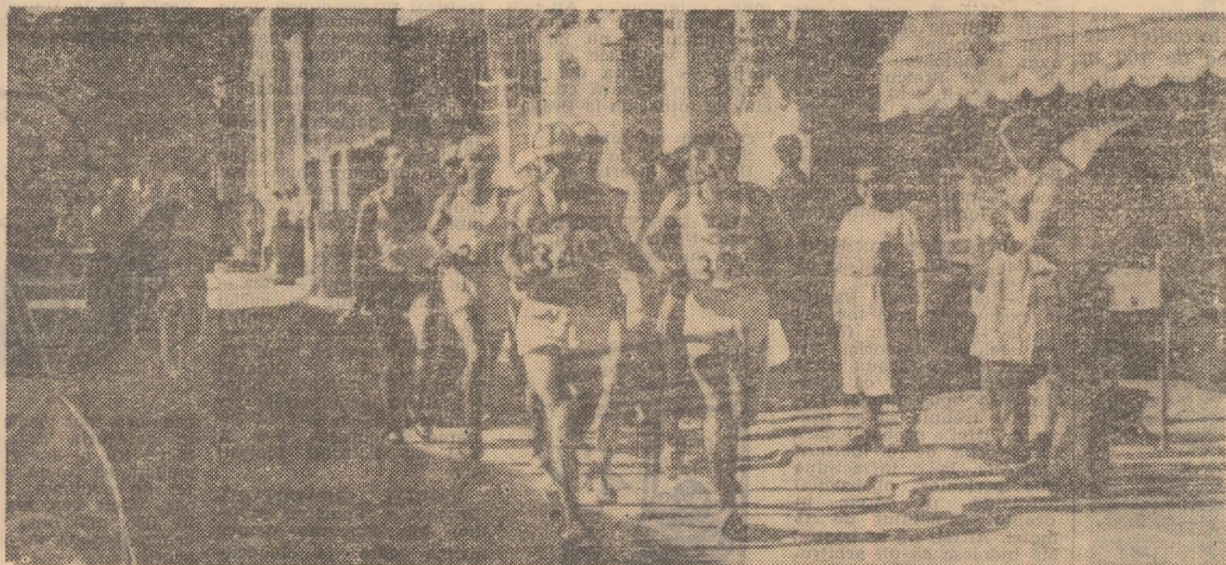
Instantaneu din întrecerea maratonisților