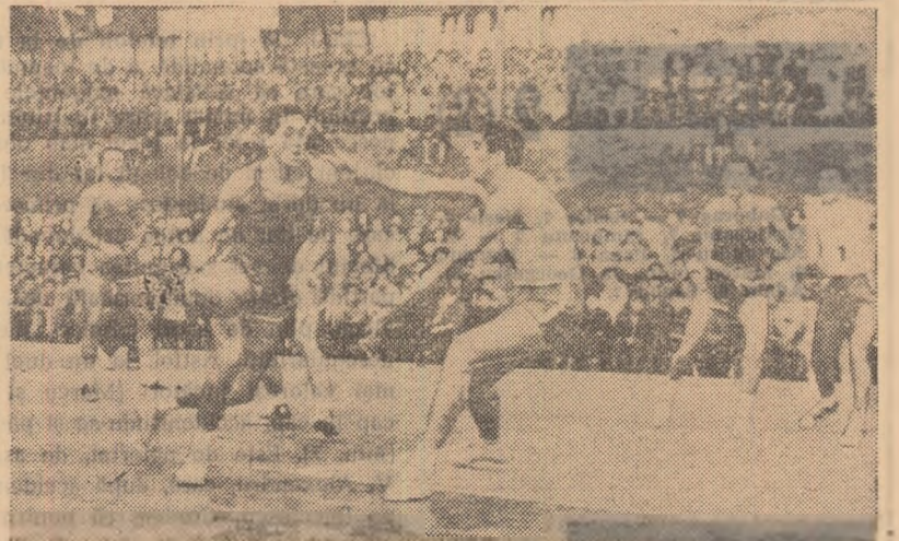
Novac (Dinamo București) pătrunde și va înscrie. De-a lungul turneului, el a constituit unul dintre factorii buneii comportări a echipei sale.