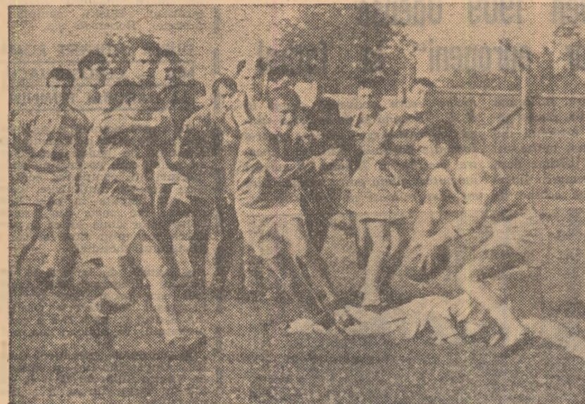
Faza din meciul Constructorul — Steaua, una dintre cele mai frumoase partide de campionat din ultimii ani

Rezultatele cîtorva dintre participanți: BĂRBAȚI: 100 m: L. Bădescu (P) 11,0; I. Orghidan (Bc) 11,0; 800 m: I. Pană (B) 2:03,8; triplu: V. Sirbu (Bc) 13,25; L. Dobaj (M-AM) 13,24; 4x100 m: Ploiești 43,9 — rec. reg. jun. I; FEMEI: 100 m: V. Anghel (Pl.) 12,6 — rec. reg. jun. II; 400 m: El. Baciu (Bc.) 59,0; înălțime: E. Stoescu (B) 1,60; greutate: A. Macovei (Bc.) 12,32; suljă: El. Burlacu (Pl.) 38,26 — rec. reg. jun. I.