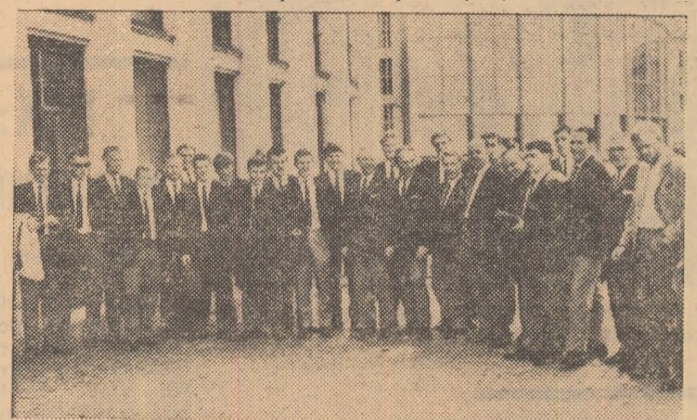
Iată-i pe jucătorii de la Boldenklubben 1909, la câteva minute după aterizarea avionului.