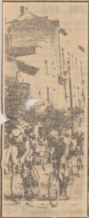
Cicliștii trec prin Salonta. în etapa a II-a

Anul XXI — Nr. 4781 ★ Vineri 1 octombrie 1965 ★ 4 pagini 25 bani