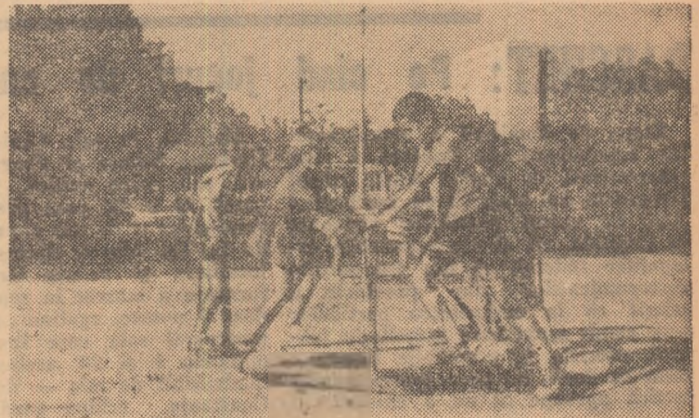
Intii pași în sport!... Un loc de joacă pentru copii în cartierul Balta Albă.