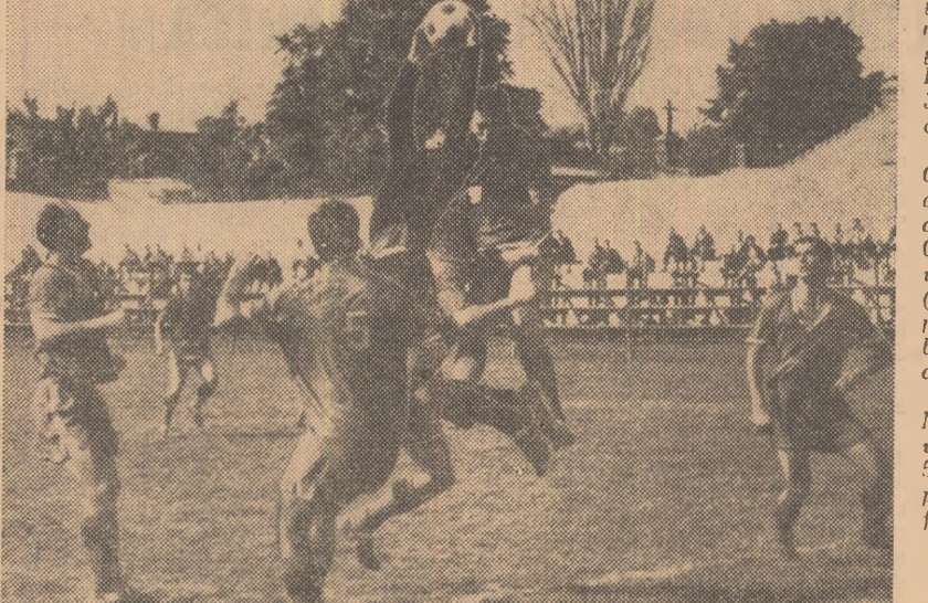
Dispută aeriană în careul de 16 m al echipei oaspete. Fuză din meciul Flacăra roșie București—Metrom Brașov 0—0.