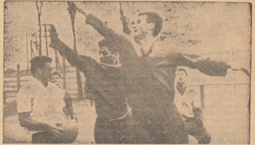
Stimulați de startul „tare” din actualul campionat, fotbalistii de la Rapid manifestă multă poftă de lucru în timpul antrenamentelor.

Material redactat de Cr. MANTU, M. TUDORAN și C. ALEXE