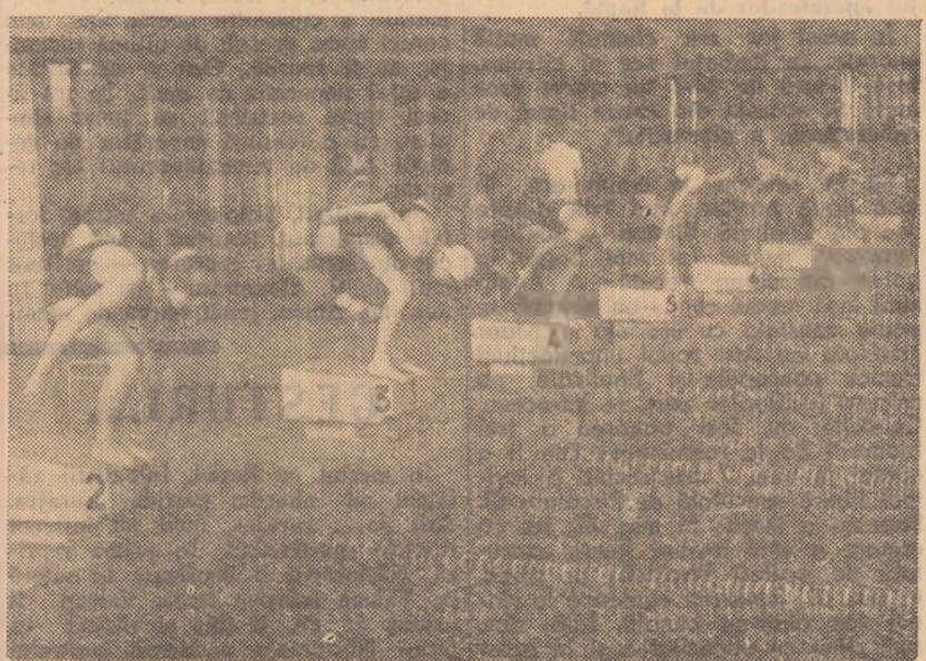
Un aspect de la un concurs de natație rezervat copiilor, care a avut loc la Berlin.

• La Tîrgul internațional de mostre de toamnă de la Leipzig standu-