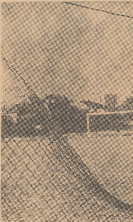
Grija pentru ca spectatorii să aibă o bună vizibilitate? Nu. Lipsa de spirit gospodăresc...