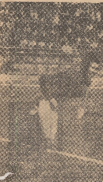
care a inregistrat al treilea gol semnare balonul care va intra Metalul Bucuresti - Otelul