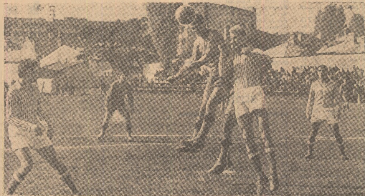
Apărarea oaspeților — tricouri deschise — face cu greu față atacurilor insistente ale bucureștenilor. (Fază din meciul de categoria C Flacăra roșie București — Portul Constanța 1—1)

Biletele pentru cuplajul de fotbal PROGRESUL — METALUL BUCUREȘTI și RAPID — STEAUA care va avea loc duminică 31 X. 1965 pe stadionul 23 August, se pun în vânzare începînd de joi 28.X.1965 la casele de bilete obișnuite.