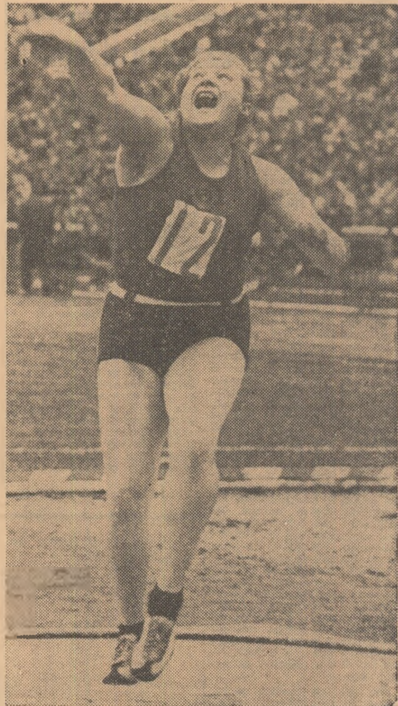
De ani de zile, atleta sovietică Tamara Press domină cu autoritate probele de aruncarea greutății și discului. Cu excepționalele sale performanțe de 18,59 m și — respectiv — 59,70 m, ea deține recordurile mondiale în aceste probe

După cum se știe, Nona Gaprindașvili a participat cu succes la mai multe ediții ale campionatului masculin de șah al Gruziei, precum și la turneele internaționale de la Hastings și Reykjavik