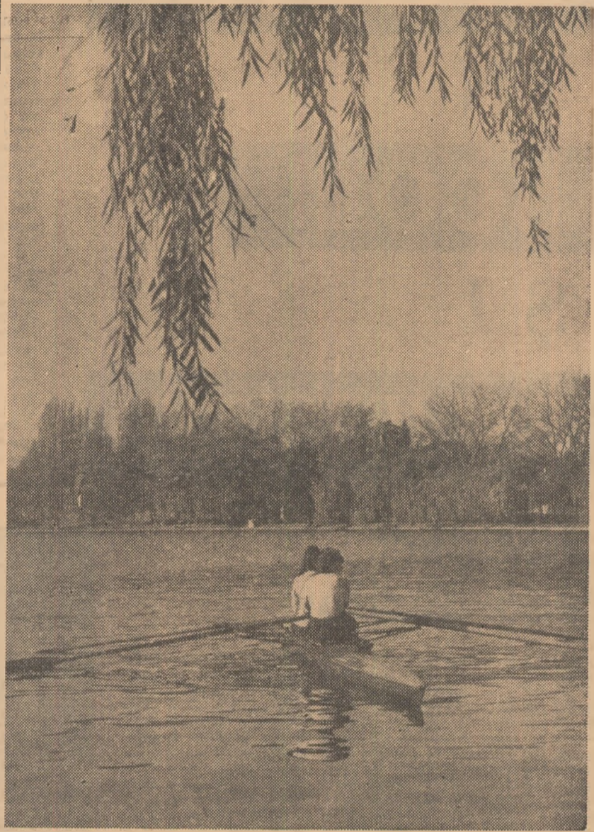
... pe Herăstrău