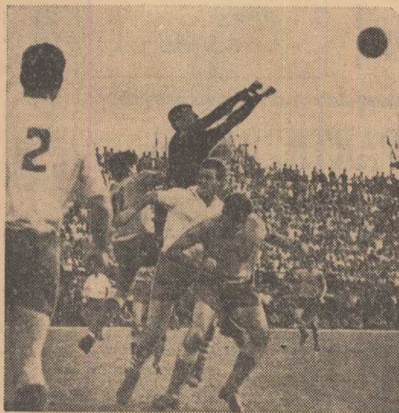
Partidele Dinamo — Petrolul au fost întotdeauna foarte disputate. Ilustrativă, în acest sens, lăza de mai sus surprinsă cu ocazia ultimului meci dintre cele două echipe

meciul Dinamo-Petrolul, subliniem ca deosebit de interesantă lupta atacului petrolist, care are în Dridea I și în Dridea II doi jucători cu o putere