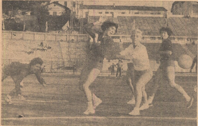
Selecionata țării noastre debutează miine în compania reprezentativei Poloniei. În fotografie, o fază din meciul România — Polonia, disputat în 1962 la București, cu prilejul ediției anterioare a campionatului mondial, și încheiat cu victoria handbalistelor noastre (9—4)

Desigur că pentru echipa noastră sarcina este cu atât mai dificilă, cu cât are de apărut titlul cucerit în 1962, în compania unor adversare re-dutabile care au obținut anul acesta rezultate valoroase: Cehoslovacia, Ungaria și Polonia. Dar, pregătirile