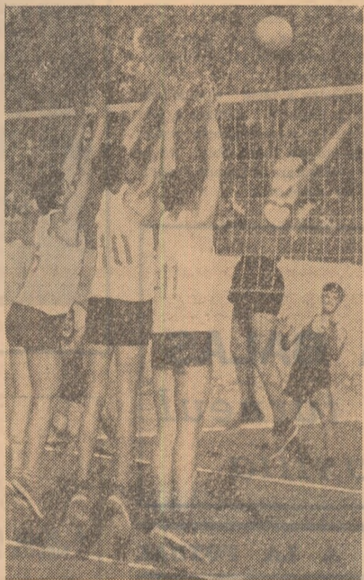
Baraj de netrecut în fața plasei! Se întrec echipele anilor III-strungari și IV matrice