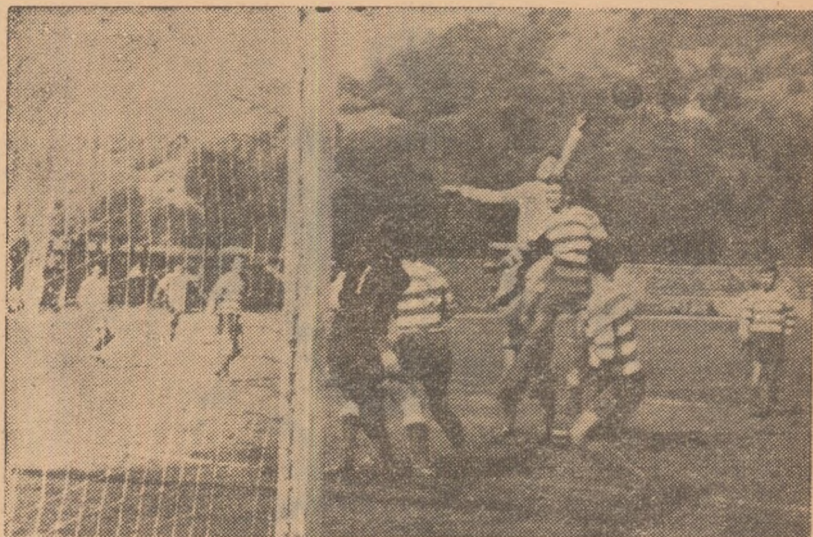
Correspondenții noștri ne trimit adesea fotografii realizate cu prilejul unor manifestații sportive. Iată, de pildă, această imagine din meciul de categorie C, seria Nord, dintre Sătmăreana și A. S. Aiud, trimisă de L. Chira Baia Mare

Fotbaliștii de la Crișul au plecat vineri la prînz cu autobuzul spre Pitești, unde vor face azi un ultim antrenament. În lotul echipei se ridică semne de întrebare asupra participării lui Harșani și Bacoș la meciul cu Dinamo Pitești. Formația probabilă este alcătuită fără ei: Marin — Sacaci II, Solomon, Pojoni, Balog — Vigu, Alexandru — Mureșan II, Mureșan III, Sacaci III, Iacob. (Ilie Ghișu — coresp. reg.)