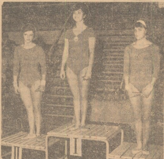
Festivitate de premiere la paralele, fetei