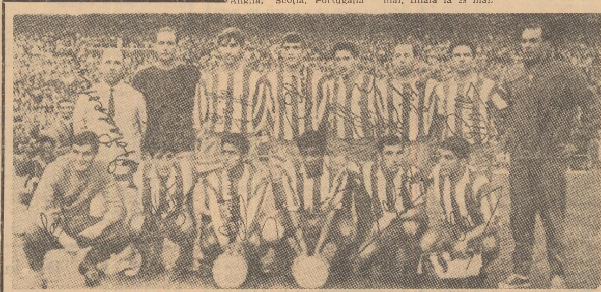
Echipa Atletico Madrid — care va înfrîna mîine la Cluj echipa Știința, în „Cupa cupelor” — conduce în campionatul Spaniei. Duminică, Atletico a obținut o nouă victorie, învingînd de data aceasta formația Sabadell cu 1—0. Ea totalizează 15 p fiind urmată de Real Madrid cu 14 p și Pontevedra cu 13 p. Iată echipa de bază a madrilenilor:

Jocurile din cadrul grupelor au loc între 21 și 25 mai, semifinalele la 27 mai, finala la 29 mai.