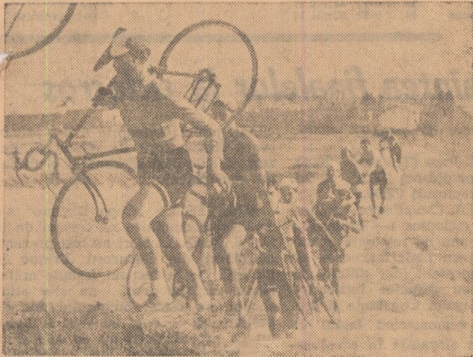
Ciclocrosiștii „escaladează” primul obstacol... (Fază din desfășurarea „Cupei Steaua”)