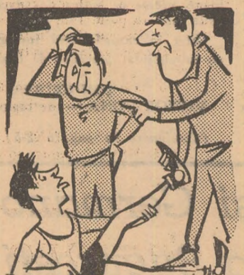
Antrenorul: Fii liniștit, am trimis să caute un doctor în oraș!

Duminică dimineața în timpul meciului de volei Steaua — Știința Timișoara în sala Dinamo, a lipsit asistenta medicală.