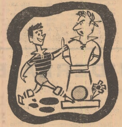
Seniorul: — Voi sinteți urmașii... NOȘTRI?