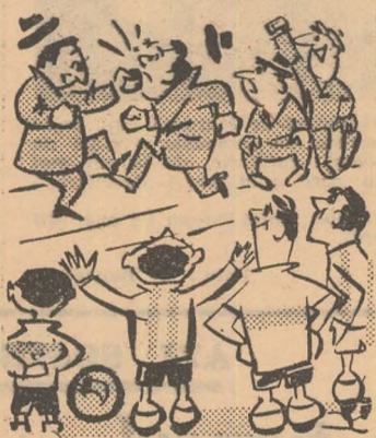
Fotbaliștii: Dacă am trage și noi la poartă cum trage el la bătărie...