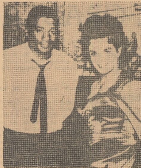
CAMPANIA publicitară în jurul apropiatului meci Clay-Patterson pentru titlul mondial la toate categoriile este în plină desfăşurare... Organizatorii disputei au pus în acţiune toate mijloacele pentru a atrage atenţia asupra acestui eveniment, merit să refacă — pe cât posibil — prestigiul atît de scăzut al boxului profesionist. Iată-l aici pe fostul campion Floyd Patterson pozînd la Hollywood cu una din admiratoarele sale, tînăra actriţă Jane Russell.

Cu această ocazie forul de rugbi al departamentului francez a propus ca în 1967 să aibă loc un turneu triumfial la care să participe pe lîngă selecţionata Pirineilor şi reprezentativele oraşelor Bucureşti şi Dublin.