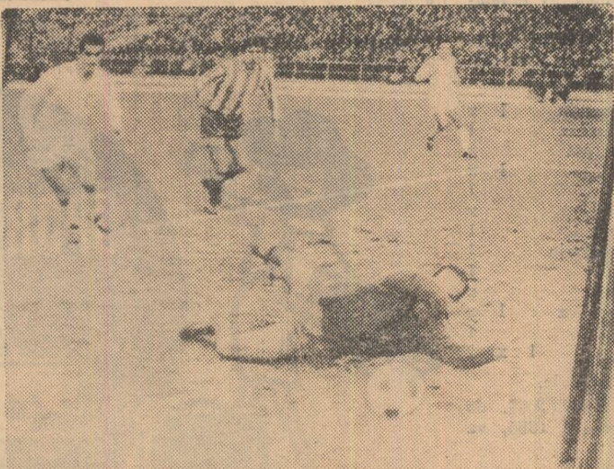
Atac al Științei la poarta lui Atletico Madrid