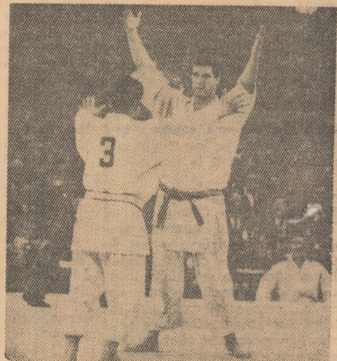
URIAŞUL Geesink se retrage! Definitiv, ne asigură agenţiile de presă. Campionul olimpic de judo, laureat şi la ultimele campionate mondiale, se va dedica de aci încolo profesiei de antrenor sau — zice-se — celei de actor de cinema. În fotografie, îl vedem pe Anton Geesink (din faţă) în cursul ultimului său meci susţinut la mondiale.

F.I.F.A. A HOTĂRIT ca echipele calificate în turneu final al campionatului mondial să nu se întînească între ele în meciuri amicale, în perioada 11 iunie—30 august 1966. Echipele finaliste nu au voie nici să joace în compania unor formaţii de club care au în componenţa lor mai mult de 7 jucători din lotul comunicat F.I.F.A. pentru turneul final al campionatului mondial.