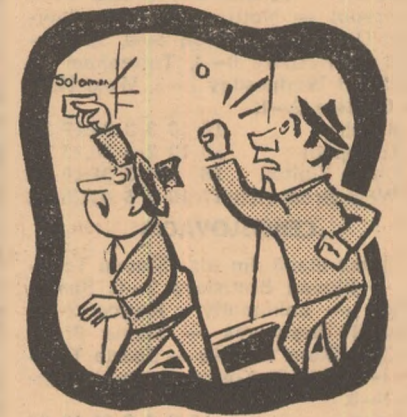
— Scoală Soli și du-te la serviciu, că dacă ne mai îți mult îl pierdem noi pe-al nostru!

Cum a înțeles Solomon dovezile de prețuire ce i s-au ardat? Judecați și dv. Jucătorul orădean este încadrat la „Întreprinderea de instalații și