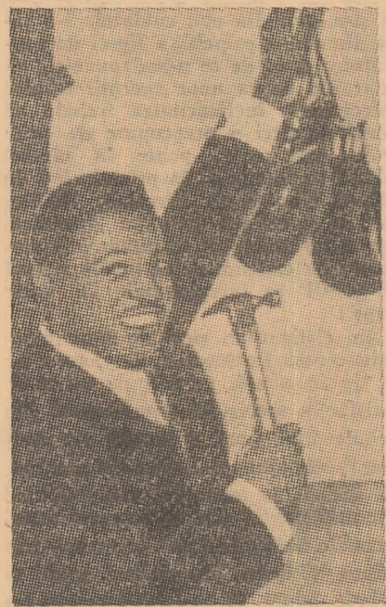
O fotografie simbolică: Ray „Sugar” Robinson pune (definitiv) mînușile în cui...

Unul din cei mai buni boxeri ai tuturor timpurilor, negrul american Ray