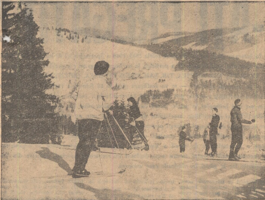
Peisaj de iarnă la Vatra Dornei