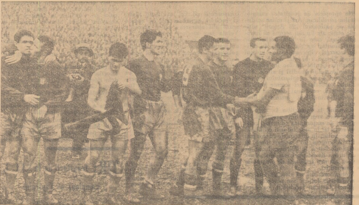
Cîteva clipe după fluierul final al meciului România — Portugalia (2—0). Eusebio, „lunarul” care n-a marcat nici un gol la București, îl felicita pe Badea și toată echipa română. De la stînga la dreapta: Pîrcălab, Ghergheli, Greavu, Dridea I, Badea, D. Popescu, Ionescu, Eusebio (care-l maschează pe Popa), Hălmăgeanu.