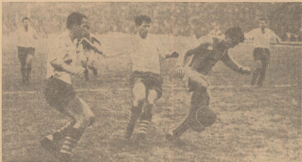
Ataș constănțean la poarta echipei Dinamo. Fază din meciul Dinamo București — Farul, disputat în campionatul trecut