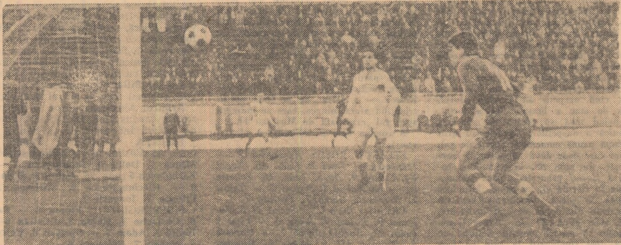
Deși poarta era goală, balonul trimis de Codreanu se lovește de bară