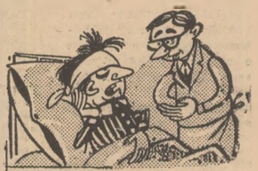
Doctorul: — Nici un medicament nu-ți pîrște. Cu ce să mai încercăm?