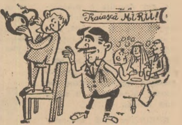
Sportivul: — M-am speriat degeaba! Mi-au spus unii că mirii au schimbat... „inelele”.

Administratorul sălii de sport din Cisnădie, Fr. Rudolf, a organizat mai multe nunți în această sală, schimbîndu-i astfel destinația (I. Ionescu-coresp.).