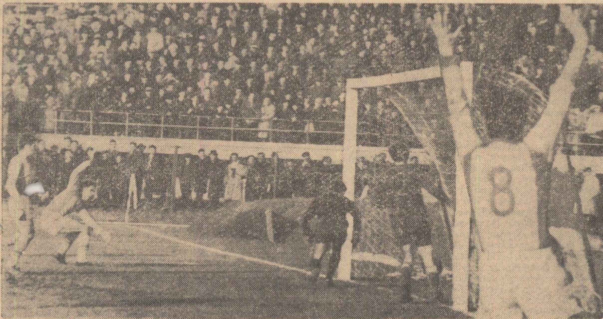
REZULTATELE DE IERI