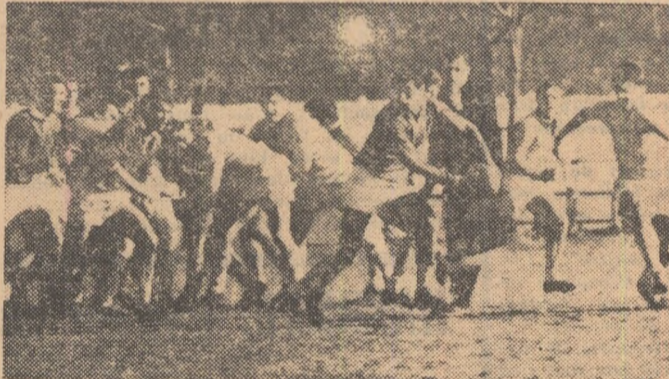
Un moment dificil pentru studenții clujeni: rugbiștii militari inițind un nou atac.

Ținînd să termine „în forță” întrecerea pentru titlul de campionă, care i-a revenit, de altfel pe merit, Dinamo București a practicat în ultimul meci al competiției, în compania Constructorului, un joc bun, deschis, „la mînă”. Și, bineînțeles, a obținut o victorie comodă, la un scor mai mult decît concludent: 44—14 (18—6). La realizarea acestei partide frumoase și-a adus contribuția și Constructorul care n-a „închis” în nici un moment jocul.